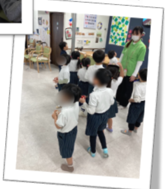
子供たちと一緒におやつを食べ、豆まきを行いました。レクでは利用者様が作成した紙飛行機で紙飛行機飛ばし大会をし、利用者様及び園児たち大変喜ばれていました。